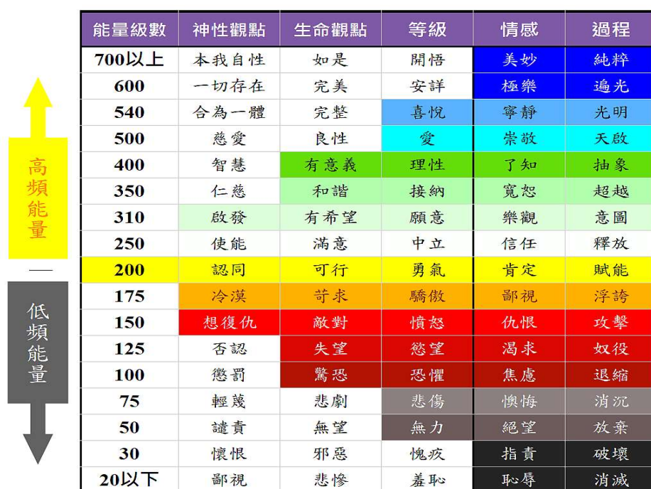
圖 2 意識能量層級分布圖（筆者依據霍金斯博士研究及網路資料整理）

基於量子世界觀與生命觀，我們可知萬物的連接，並瞭解生命能量的重要性，更理解意識決定能量層級的機制。意識能量層級會決定我們的看法，處在不同意識層級的人，會做出完全不一樣的言行與決策，因而帶來迥異的結果 2 ，若領導人想改變團隊表現就要先領導自己，來改變自己的意識層級，就能不靠權威讓人自願跟隨，並完成團隊使命。